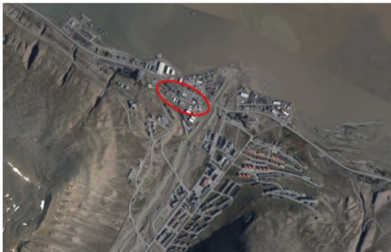
Figur 1 Lokalisering av planområdet markert med raud sirkel på ortofoto. Kjelde: Utklipp frå planbeskrivinga.

eksisterande bebyggelse fjernast og erstattast av ny for å kunne utnytte området på ein betre måte.